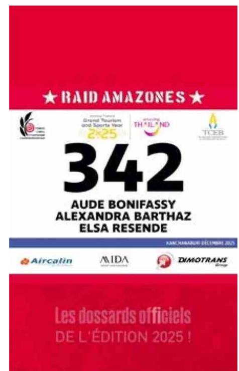
Le dossard était dans le package du voyage.

“Une expérience sportive, humaine et solidaire