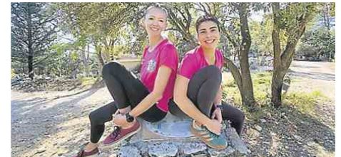
Les deux jeunes femmes s'entraînent très régulièrement.

Correspondante Midi Libre : patricia.levrault@gmail.com