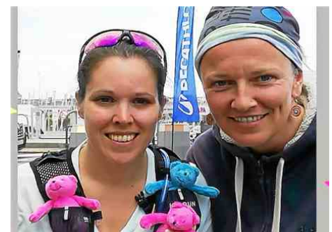
Le 15 décembre 2024, les deux femmes officialisent leur inscription au Raid Amazones , sous les couleurs des P'tits Doudous. L'équipe 12, sous le nom d' « Aliba-Breizh » est née.

« Je pense qu'au retour, nous serons des mamans changées, plus riches de toutes ces rencontres. Et peut-être prêtes, qui sait, à imaginer un autre défi ».