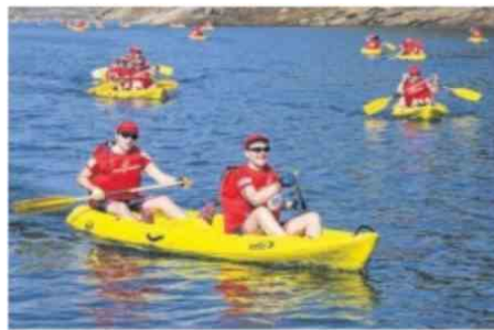
La Pontoisienne s'est mise très tard à la pratique sportive, avant de s'engager dans l'aventure du Raid Amazones . Eric Montgobert

avais envie d'y aller », sourit-elle. Elle se met à l'équitation, non sans appréhension. Il lui faudra un an pour réussir à galoper. Aujourd'hui, elle est propriétaire de son cheval et participe à des concours de saut d'obstacles depuis dix ans. À cinquante ans, elle concourt même aux championnats de France.