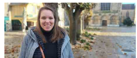
Le 15 décembre 2024, les deux femmes officialisent leur inscription au Raid Amazones , sous les couleurs des P'tits Doudous. L'équipe 12, sous le nom d'