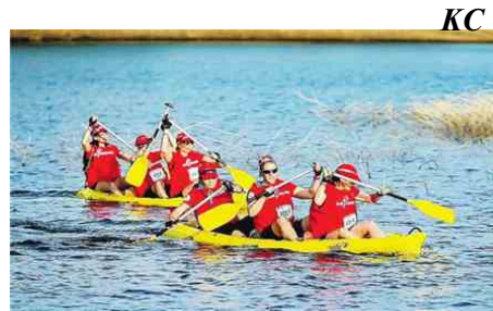
Les Héraultaises affronteront la nature et leurs adversaires