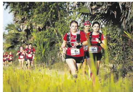
Une aventure physique et humaine.