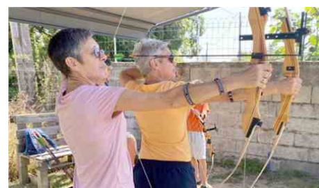
Le tir à l'arc est l'une des épreuves du Raid Amazones 2025

essaierons de pousser un peu plus loin dans nos efforts . »