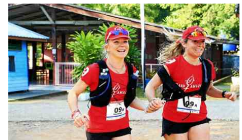
Les deux Forestoises étaient fières de passer la ligne d'arrivée du trail.

prépare maintenant pour le marathon de New York en 2026, sans écarter de participer à un nouveau Raid Amazones . D'ici-là, les sportives annoncent proposer une nouvelle édition Raid'blondes en mai 2026, où des marches et courses seront proposées.