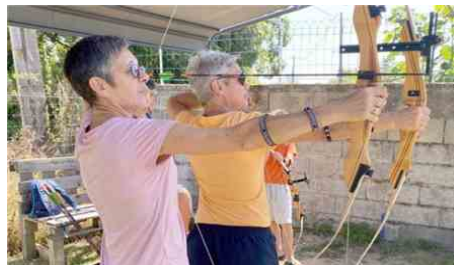
Le tir à l'arc est l'une des épreuves du Raid Amazones 2025